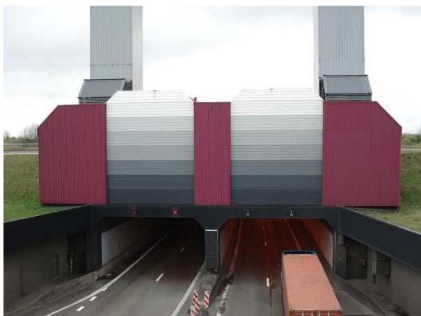
Tunnel payant à Anvers

Il existe un seul ouvrage payant en Belgique : le Liefkenshoektunnel passant sous l'Escaut dans la région anversoise. Depuis 2017, l'accès à la ville d'Anvers est payant ou interdit pour certaines voitures. Dès 2018, Bruxelles va aussi restreindre l'accès de son territoire avec une zone basse émission. Malines et Gand feront de même. Sur le reste du territoire, un péage autoroutier - au kilomètre - est toujours à l'étude.