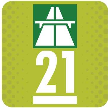
La vignette autoroutière suisse

En Suisse, les redevances routières constituent un véritable panaché. Il y a la vignette autoroutière annuelle. Il faut encore y ajouter deux tunnels frontaliers payants : le tunnel du Grand-Saint-Bernard et le Munt La Schera. Le train-auto est obligatoire pour certains tunnels. Il y a aussi les bacs.